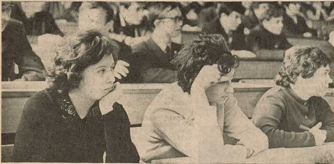
Лекцыю «Аб магчымасці сувязі з пазазямнымі цывілізацыямі» для студэнтаў-фізікаў I курса чытае прафесар В. Г. Вафіяндзі.